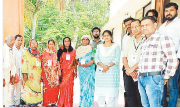
बाबा धाम जाने के लिए तैयार तीर्थ यात्री।

हरिभूमि न्यूज >>> कोरबा सहित नगर पालिका परिषद के सभी अधिकारी व कर्मचारी ने श्रद्धालुओं को शुभकामनाएं दी है। मुख्यमंत्री तीर्थ यात्रा दर्शन योजना विशेषकर वरिष्ठ नागरिकों और भक्तों के लिए जीवन की ऐसी सुखद अनुभूति बन रही है, जो वर्षों तक स्मृति में बस जाए। इससे ना केवल धार्मिक आस्था पुष्ट हो रही है, बल्कि समाज में संस्कार, सेवा और संस्कृति का संदेश भी व्यापक रूप से फैल रहा है। बैद्यनाथ धाम, भगवान शिव के बारह ज्योतिर्लिंगों में से एक है और इसे मोक्षदायक तीर्थ माना गया है। शासन की यह पहल हर घर से शिव भक्त बैद्यनाथ पहुँचने के भाव को साकार करती नजर आ रही है। नगरवासियों ने इस आयोजन को सहज सेवा और सत्कर्म का संगम बताते हुए मुख्यमंत्री और शासन प्रशासन का आभार जताया। इस पहल ने तीर्थयात्रा को ना केवल संभव बनाया, बल्कि इसे एक सामाजिक एवं आध्यात्मिक महोत्सव का रूप दे दिया।