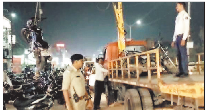
वाहनों को जब करती यातायात पुलिस।

शहर की सड़कों पर शाम होते ही लोगों की भारी भीड़ होती है। ज्यादातर लोग गर्मी के दिनों में ही शाम को बाहर निकलते हैं ताकि शाम को मांकेट में पहुंचकर अपने जरूरत के हिसाब से सामानों की खरीदी कर सकें लेकिन शाम के समय ही शहर के मार्ग में लगे बेतरतीब वाहनों को पार्किंग कर देते हैं जिसकी वजह से यातायात व्यवस्था बाधित होती है। ऐसे वाहन चालकों को सबक सिखाने के लिए यातायात पुलिस सड़कों पर क्रेन लेकर लगातार पेट्रोलिंग कर रही है और सड़क पर पार्किंग करने वाले बाइक चालक, चार पहिया वाहन चालकों के खिलाफ लॉक करने की कार्रवाई कर रही है।