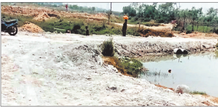
मिलाईखुर्द स्थित नाला जहां तैयार किया गया रैप।