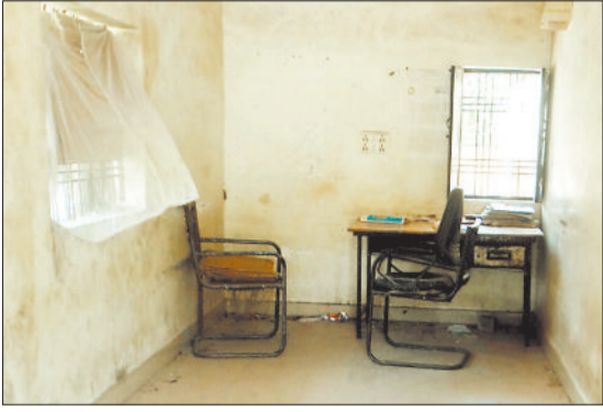
नेहरू नगर सब स्टेशन में एरुज कॉल सेंटर से कर्मचारी गायब।

बिलासपुर। बिजली कंपनी जिले में मैनपावर की समस्या से जूझ रही है। रिटायरमेंट के बाद खाली पदों को नहीं भरे जाने से सिटी सर्किल में लाइनमैन, सहायक लाइनमैन, हेल्पर की कमी बनी हुई है। विभाग मेंटेंस और मरम्मत के लिए टेकेदार के कर्मचारियों के भरोसे ही है। वहीं टेकेदारों के द्वारा लापरवाही बरती जा रही है, जिसका खामियाजा उपभोक्ताओं को उठाना पड़ रहा है। यही कारण है कि चौबीस घंटे विद्युत सप्लाई देने का सरकारी सपना साकार नहीं हो पा रहा है। एक बार लाइन टूटती है या फाल्ट होता है तो मेंटेंस का कार्य पूरा होने में घंटों का समय लग जाता है।