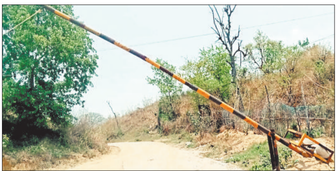
मिलाईखुर्द स्थित रेत घाट जहां लगाया जा रहा है नाका।